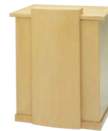
説教台 CD-2G 外寸法/W900×D630×H900 ナラツキ板ウレタン塗装 ¥630,000(税別) A101306