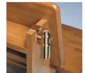
チャペルチェア用花器 CC-F