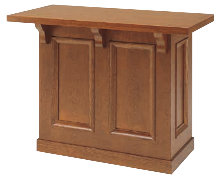
説教台 CD-2E 外寸法/W1200×D600×H900 ナラツキ板ウレタン塗装 ¥850,000(税別) A101304