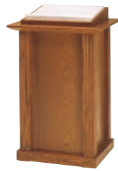
署名台 CD-8B 外寸法/W600×D550×H930 ナラツキ板ウレタン塗装 TOP/大理石 ¥600,000(税別) A101404