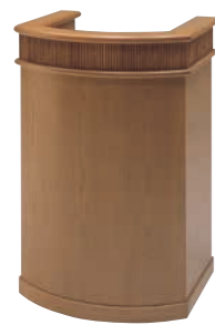
説教台 CD-2M 外寸法/W700×D600×H1030 ナラツキ板ウレタン塗装 ¥630,000(税別) A101309