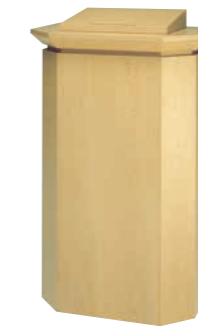
署名台 CD-8A 外寸法/W800×D500×H1280 ナラツキ板ウレタン塗装 ¥430,000(税別) A101403