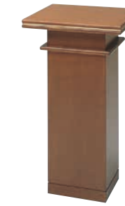
花台 CD-5N 外寸法/W500×D500×H900 ナラツキ板ウレタン塗装 ¥360,000(税別) A101601