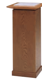
指輪置台 CD-9C 外寸法/W420×D420×H910 ナラツキ板ウレタン塗装 TOP/大理石 ¥440,000(税別) A101505