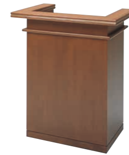
説教台 CD-2N 外寸法/W900×D600×H1050 ナラツキ板ウレタン塗装 ¥580,000(税別) A101310