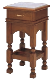
署名台 CD-8C 外寸法/W450×D450×H865 ナラツキ板ウレタン塗装 TOP/大理石 ¥600,000(税別) A101405