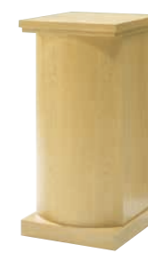
花台 CD-7F 外寸法/W450×D450×H900 ナラツキ板ウレタン塗装 ¥360,000(税別) A101603