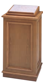
署名台 CD-8D 外寸法/W500×D450×H930 ナラツキ板ウレタン塗装 TOP/大理石 ¥480,000(税別) A101406