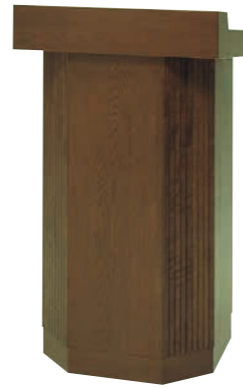
説教台 CD-2D 外寸法/W600×D450×H1075 ナラツキ板ウレタン塗装 ¥570,000(税別) A101303