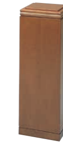
指輪置台 CD-4N 外寸法/W300×D300×H910 ナラツキ板ウレタン塗装 ¥330,000(税別) A101501