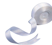
ホワイトリボンテープ