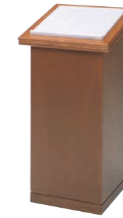
署名台 CD-3N 外寸法/W500×D500×H1010 ナラツキ板ウレタン塗装 TOP/大理石 ¥410,000(税別) A101402