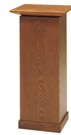
花台 CD-10C 外寸法/W420×D420×H900 ナラツキ板ウレタン塗装 ¥330,000(税別) A101606