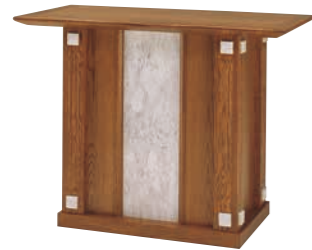
説教台 CD-2F 外寸法/W1200×D600×H900 ナラツキ板ウレタン塗装 大理石貼り ¥920,000(税別) A101305