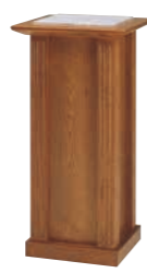
指輪置台 CD-9A 外寸法/W460×D460×H910 ナラツキ板ウレタン塗装 TOP/大理石 ¥570,000(税別) A101503