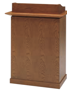
説教台 CD-2K 外寸法/W750×D550×H1020 ナラツキ板ウレタン塗装 ¥600,000(税別) A101308