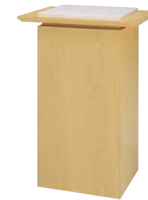
指輪置台 CD-9D 外寸法/W650×D450×H920 ナラツキ板ウレタン塗装 TOP/大理石 ¥580,000(税別) A101506