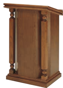
説教台 CD-2T 外寸法/W660×D520×H1025 ナラツキ板ウレタン塗装 ¥820,000(税別) A101312