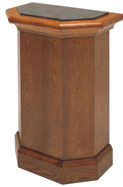
説教台 CD-2S 外寸法/W850×D600×H1115 本体/ナラツキ板ウレタン塗装 TOP/大理石 ¥600,000(税別) A101311