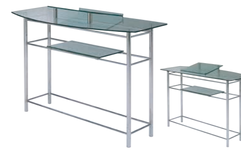
説教台 CD-2Z 外寸法/W1200×D600×H1100 ステンレス 天板/強化ガラス8t ¥660,000(税別) A101315