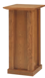
花台 CD-10A 外寸法/W460×D460×H900 ナラツキ板ウレタン塗装 ¥500,000(税別) A101604