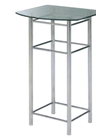
署名台 CD-3Z 外寸法/W600×D500×H950 ステンレス 天板/強化ガラス8t ¥550,000(税別) A101409