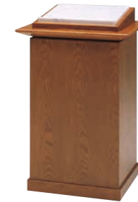
署名台 CD-8E 外寸法/W600×D550×H930 ナラツキ板ウレタン塗装 TOP/大理石 ¥410,000(税別) A101407